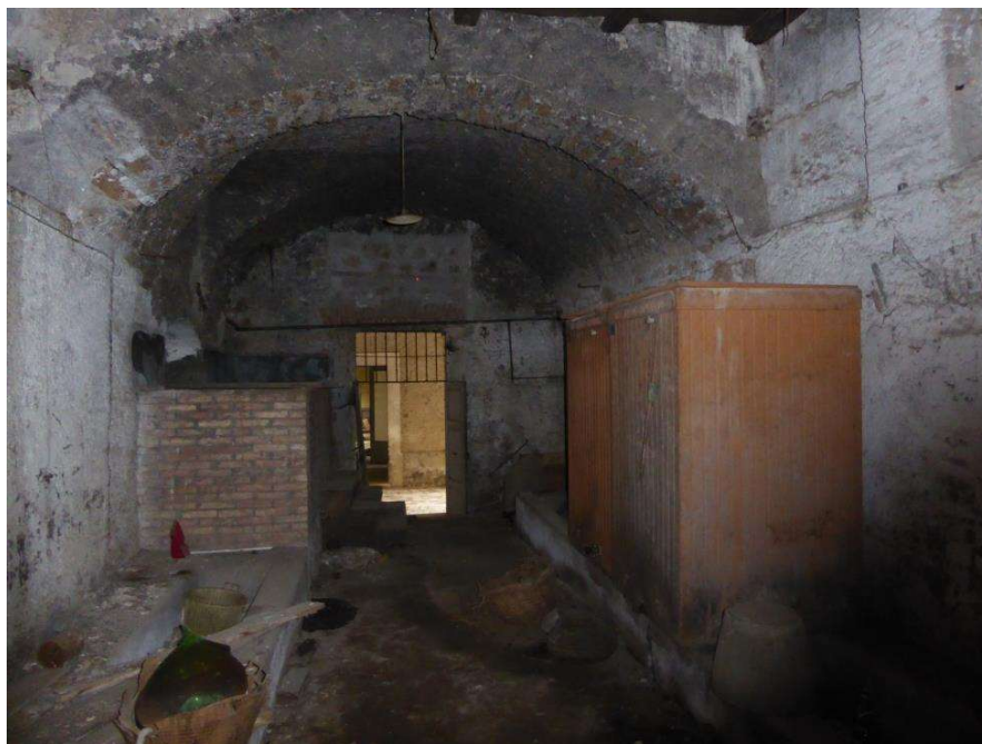
Fotografia n. 66 Vista della galleria coperta che conduce all'orto sul versante sud-ovest